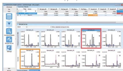
Окно ПО обработки массива данных LabSolutions Insight