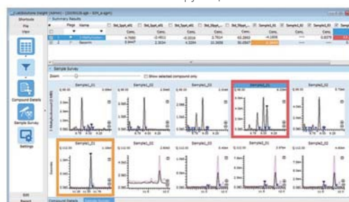
Окно ПО обработки массива данных LabSolutions Insight