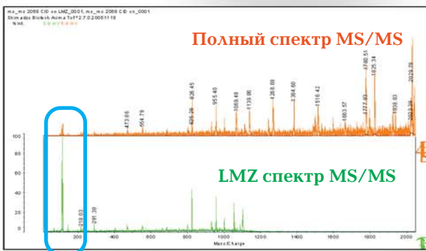
MS/MS меченого iTRAQ иона-прекурсора (2068 m/z)